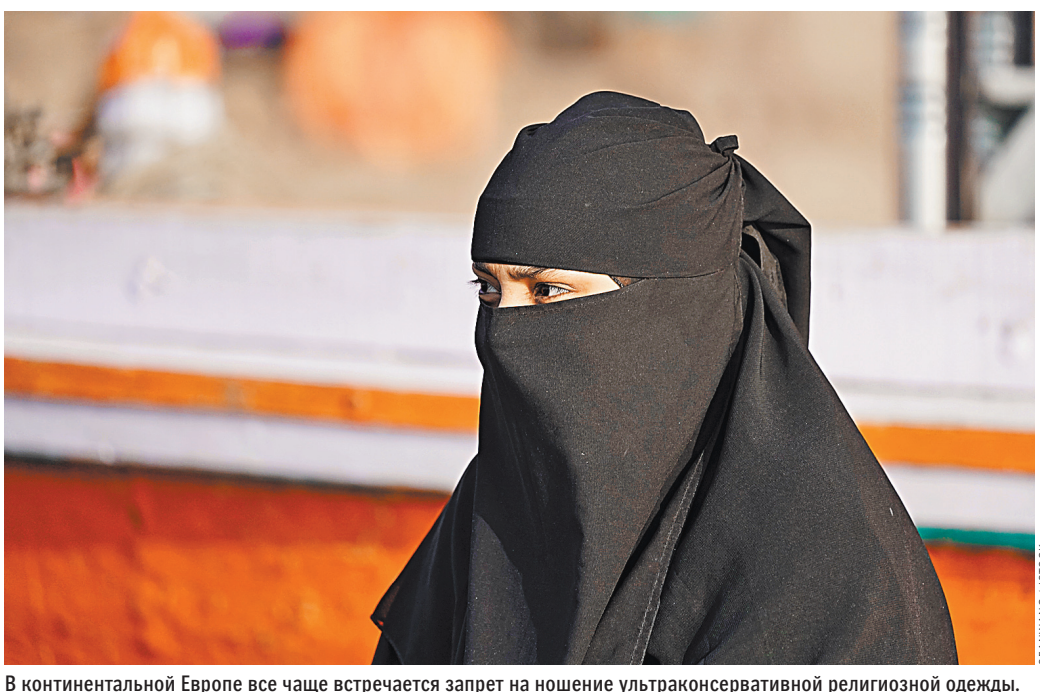
В континентальной Европе все чаще встречается запрет на ношение ультраконсервативной религиозной одежды.