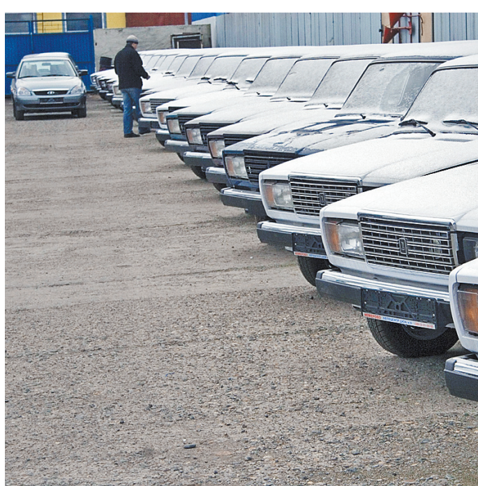
На вторичном рынке — рост продаж. В лидерах, как всегда, LADA. На первом месте LADA 2114, а на втором — LADA 2107.

Так что тем, кто приобретает подержанные автомобили, стоит учесть и этот рейтинг. Ведь тот же Nissan Qashqai хоть и не входит в 10 самых продаваемых б/у машин в России, но довольно популярен. А всегда хочется ездить на машине, а не чинить ее. ●