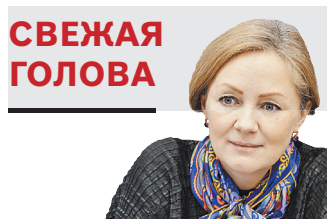
СВЕЖАЯ ГОЛОВА Мargarita Ruseckaya, ректор Государственно- го института русского языка имени Пушкина

Несомненно, сегодня цифровизация образования будет происходить, это тренд, без которого не обойтись. Но когда специалисты говорят о процессе перехода на электронную систему, хочется верить, что образовательный ресурс будет работать с помощью реальных цифровых технологий: к примеру, технологии блокчейна, искусственного интеллекта, больших данных, настоящей современной геймифика-