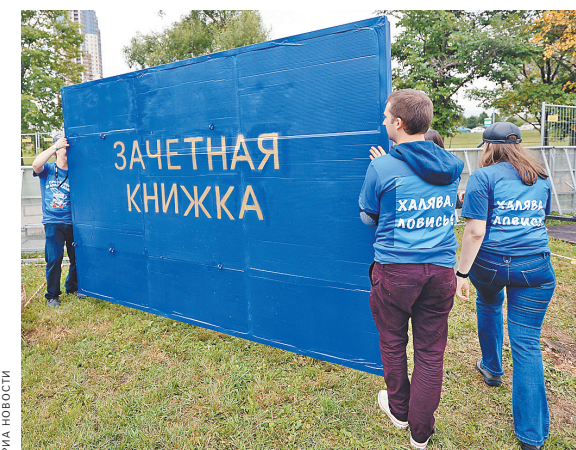
Такую зачетку по почте не выслать. А документы для перевода в другой вуз — можно.

— Бывает так, что свободных мест на момент обращения в вуз может и не быть: не только по причине сильного набора, но и из-за восстановления в вуз ранее обучавшихся. И даже при наличии места перевод может не состояться. Например, из-за недостаточной подготовки. Допустим, наш потенциальный студент не сдавал ЕГЭ по физике, а в «ЛЭТИ» она преподается на серьезном инженерном уровне. Без отличных школьных знаний ее просто не вытянуть. Но чаще всего перевод сворачивается из-за большой разницы в учебных планах вузов.