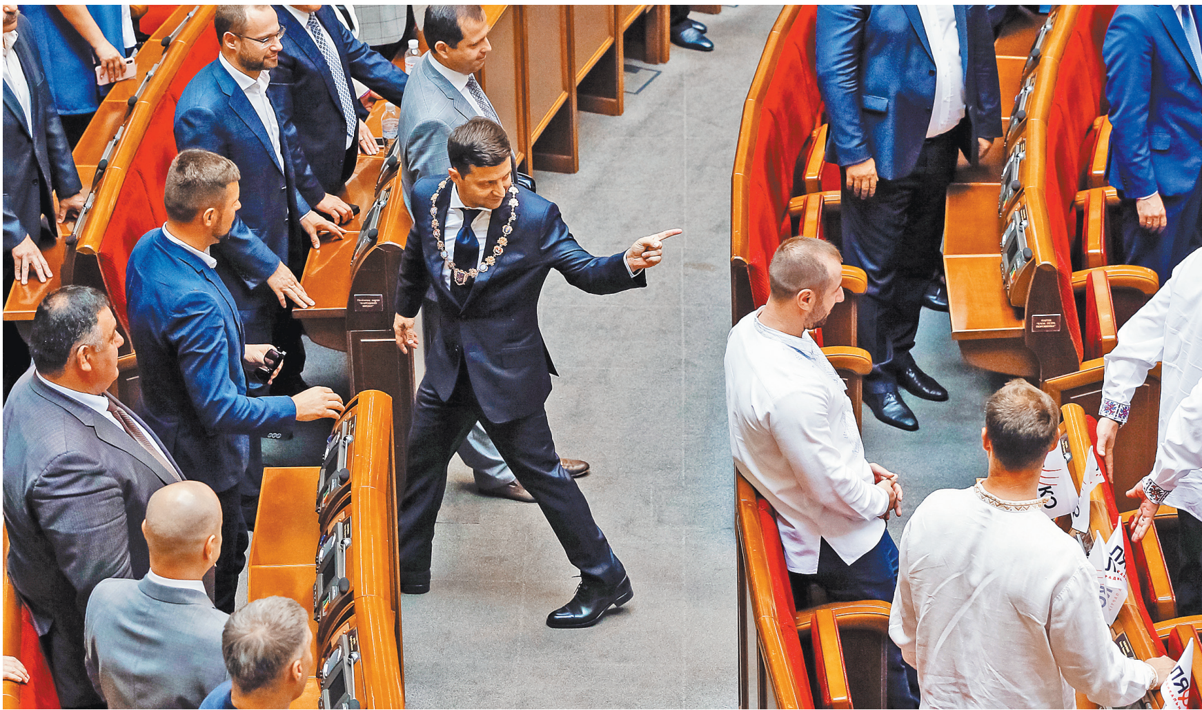
Новый президент Украины попросил «распущенных» депутатов напоследок принять ряд неотложных, по его словам, законов.

Зато он провозгласил, что украинцев со вчерашнего дня стало 65 миллионов — тех, кого родила украинская земля, в Азии, в Северной и Южной Америке, в Австралии и Африке». Всем им Зеленский пообещал украинское гражданство в случае возвращения. Только неназванный президентский спичрайтер знает, откуда возникла цифра в 65 миллионов. Ведь даже в 1989 году, до распада СССР, демографической ямы десятилетиями не было, а миграция из страны, в последние пять лет принявшей характер повального бегства, население Украины — всех национальностей — составляло чуть более 51 миллиона человек. Теперь же местные эксперты и демографы говорят максимум о 30 миллионах. Очевидно, лозунг «Нас 65 миллионов» будет использоваться его партией в парламентской кампании, как до этого аналогичный тезис «Нас 52 миллиона» эксплуатировал Виктор Ющенко. Но с точки зрения ответственного политика, каким был Рональд Рейган, о котором Зеленский многозначительно упо-