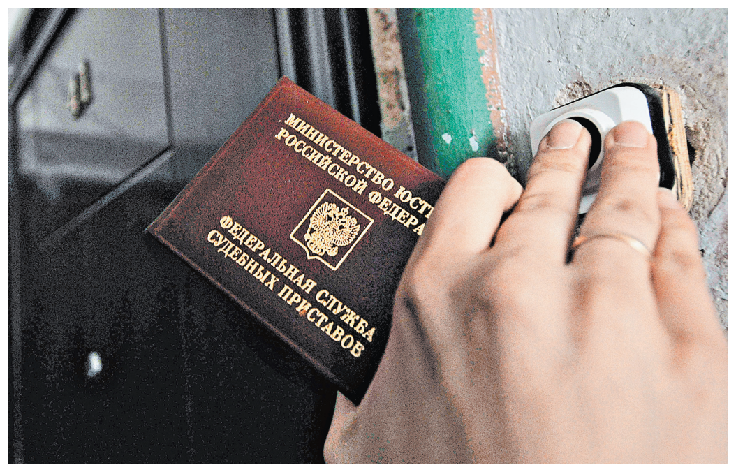
Закон разрешает приставу каждый раз штрафовать должника, не выполнившего законные требования.

Верховный суд отменил решение апелляции и вел ей пересмотреть дело еще раз с учетом его разъяснений.