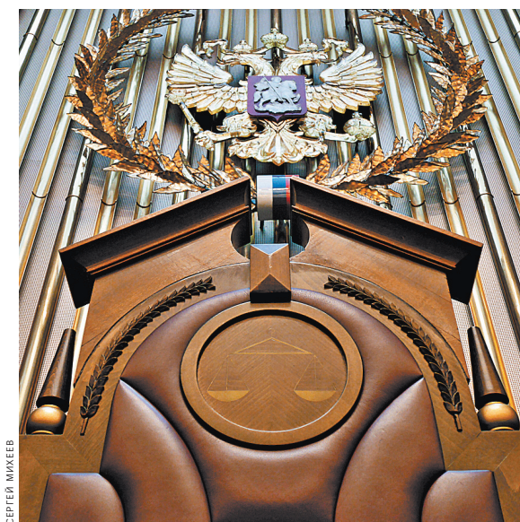
Верховный суд РФ объяснил, что менять условия обслуживания граждан банк может лишь при их согласии.

Суд первой инстанции сказал, что банк в одностороннем порядке изменил условия заключенного с истцом договора, не известив об этом клиента, «что привело к возникновению у него убытков в виде незаконно удержанной комиссии». По мнению областного суда, банк имел право брать комиссию. По словам областных судей, клиент банка вообще «пытался уклониться от соблюдения процедур обязательного контроля». То есть