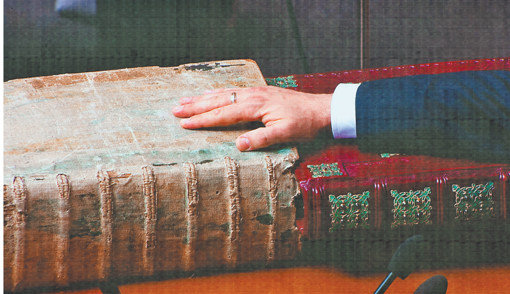
Зеленский принес присягу, положив руку на конституцию и Персонифицированное Евангелие.

Содержательная часть выступления Зеленского свелась только к призыву отставки пра-