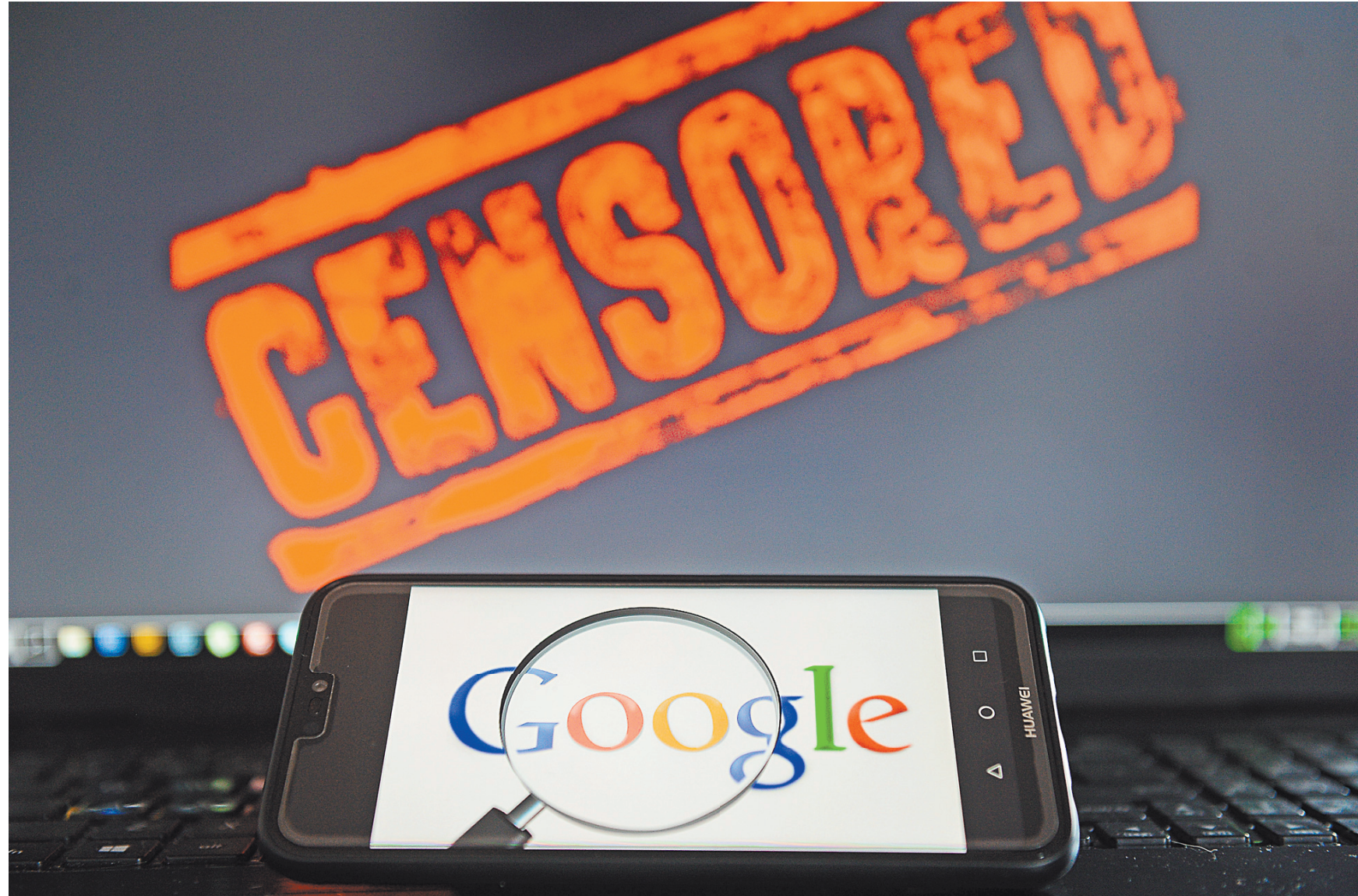
Google нашел способ, как «подвергнуть цензуре» продукцию Huawei и порадовать Трампа.

Решение Трампа объявить в США чрезвычайное положение,