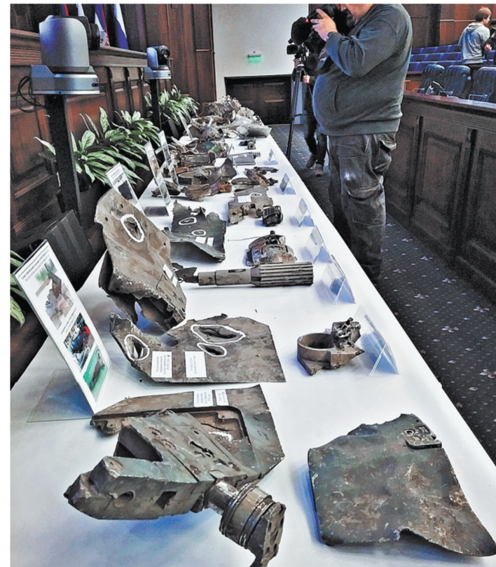
На улах и агрегатах сбитых ракет имеются отметки с серийными номерами, датами, названиями фирм-изготовителей и другие данные.

по американской версии якобы хранилось химическое оружие. Рудской напомнил: по утверждению представителей Пентагона, в наземные сооружения попали 22 ракеты. Но в Минобороны России по космическим снимкам зафиксировали не более семи попаданий. Подземное хранилище объекта «Хим Шиншар», как считают американские военные, поразили 7 ракет. По данным нашей разведки, зафиксировано всего лишь два попадания. Всего в трех районах перехвата зоны ответственности за противовоздушную оборону Хомс сирийцы комплексами «Панцирь», «Оса», «БУК», С-125