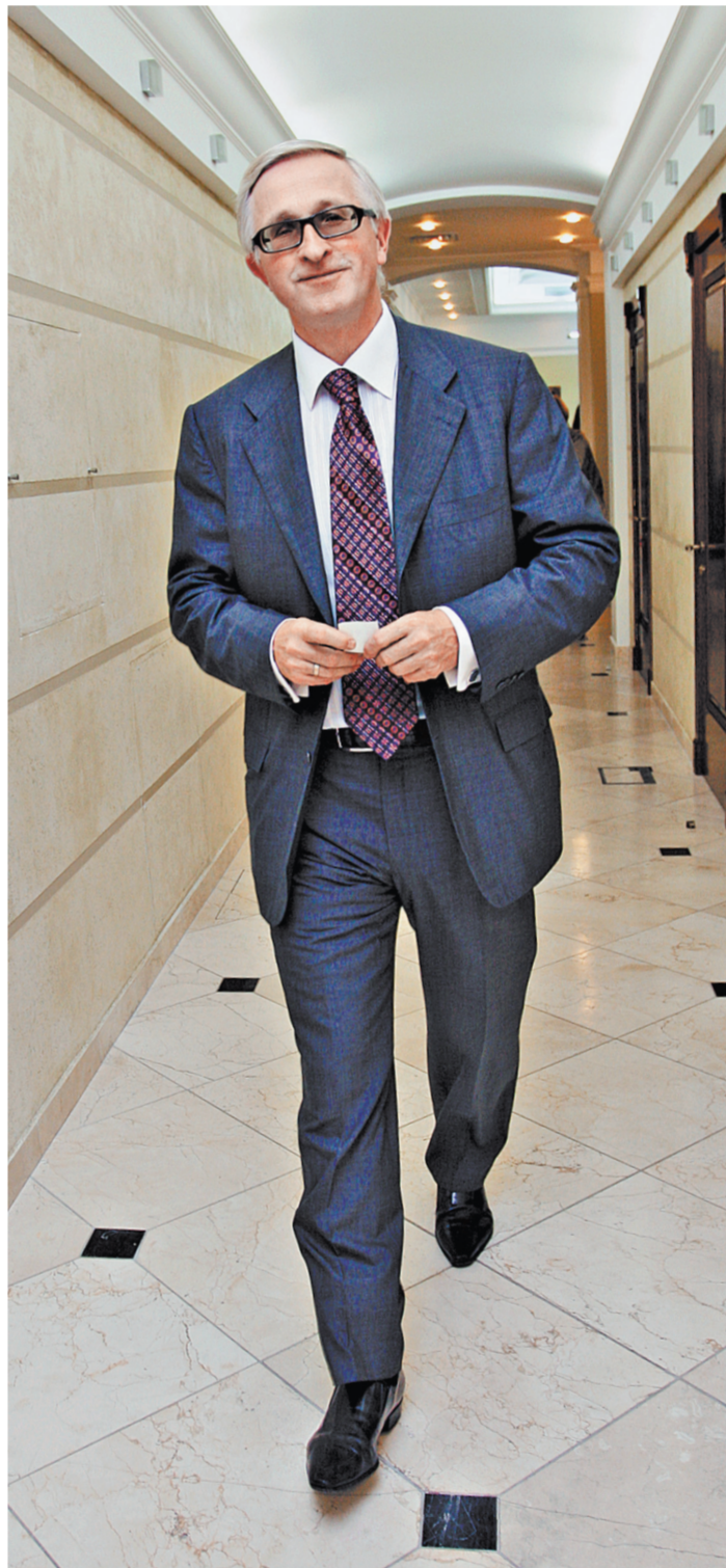
Александр Шохин: Крупный бизнес готов сам взяться за подготовку кадров.

А каковы эти запросы? Александр Шохин: Инновации, прогрессивные технологии, включая цифровые, предъявляют новые требования к персоналу, формируют новый образ труда и ведут к появлению новых профессий или кардинальному изменению основных характеристик существующих. Бизнес заинтересован в радикальных изменениях в сфере профессионального образования. Очевидно, что обновление системы подготовки квалифицированных кадров требует скорейшей модернизации системы профобу-