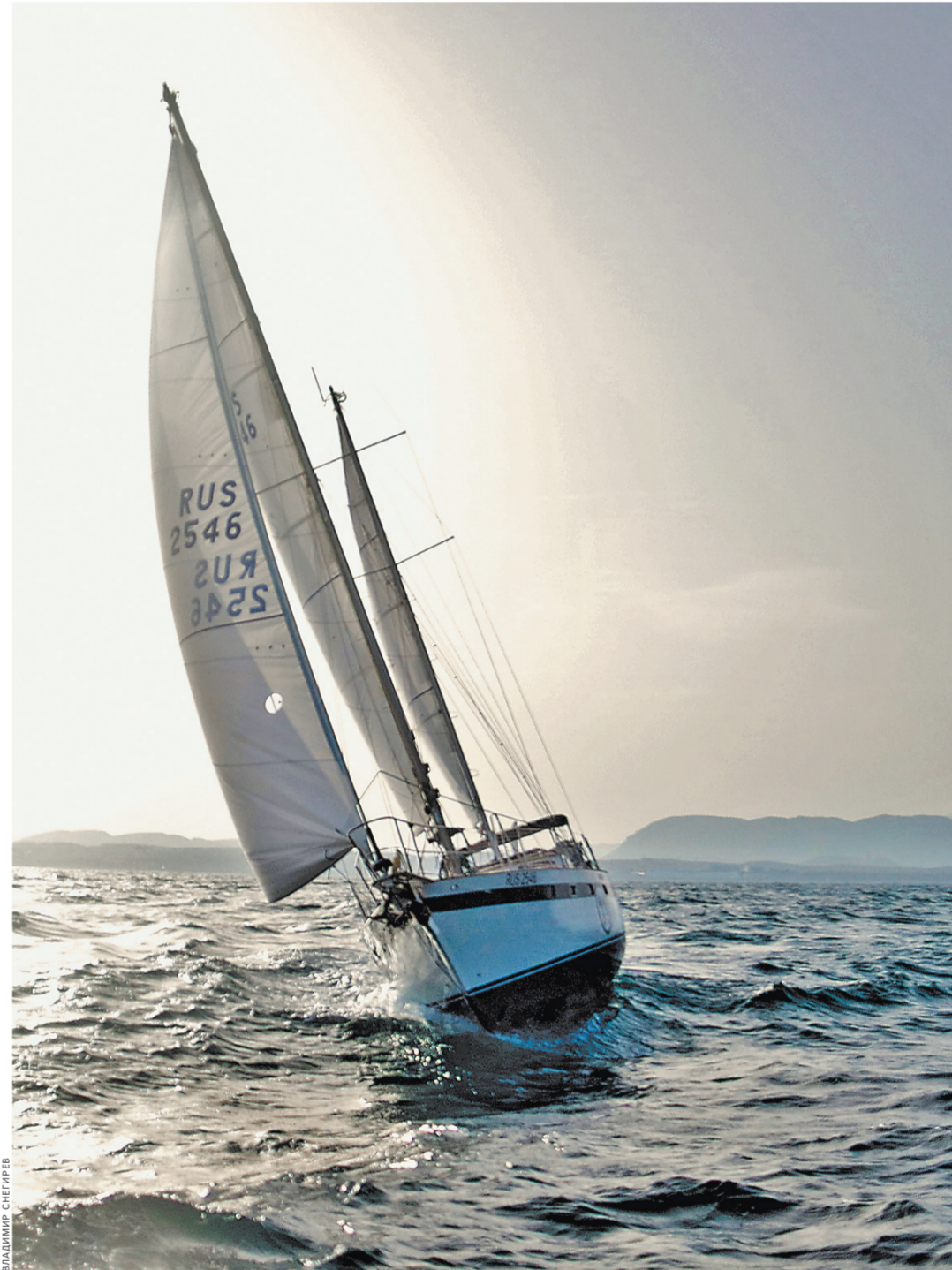
Яхте «Эсмеральда» предстоит обогнуть земной шар за 312 дней.

«Эсмеральда» храбро летела по безбрежному морю, временами зарываясь носом в воду. На мостике стоял счастливый шкипер. Я держался за все, что могло помочь не вывалиться за борт и честно признаюсь — молил бога: быстрее бы закончилось это приключение.