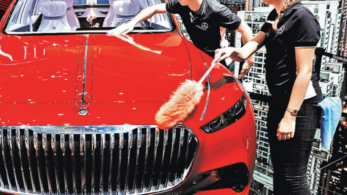
Ведорожный Maybach, еще и полностью электрический. А его салон отделан розовым золотом.

про машины такой марки уже стали забывать. А в Китае по популярности она занимает четвертое место. С него и начнем. Компания представила сразу две свои новинки. Первая — Velite 6 — это большой гибридный универсал. Его полноразмерный двигатель