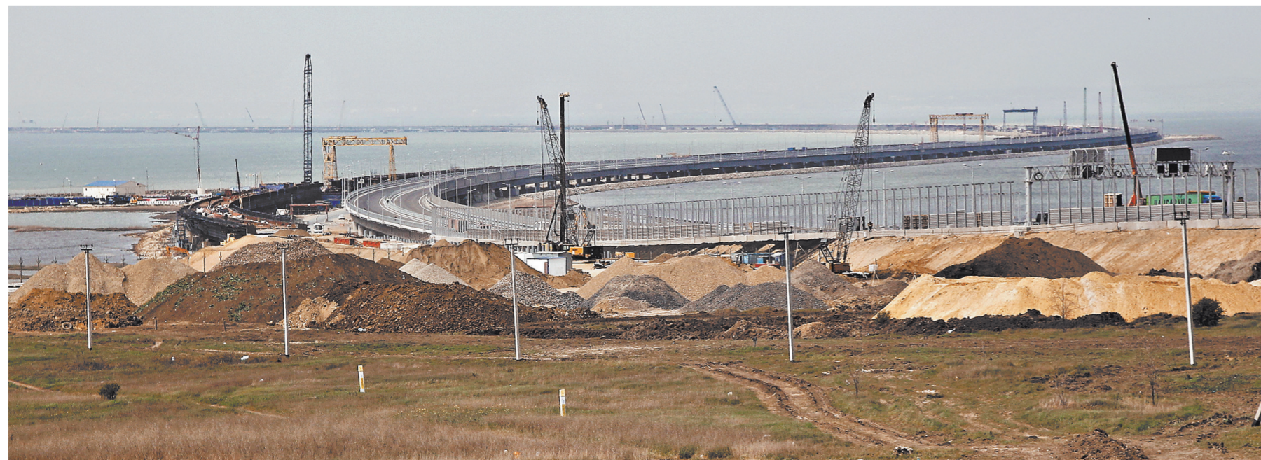
Въезд на косу Тузла: дорожники формируют откосы насыпи.

Это очень ответственно управлять таким мостом. Да и с Россией так же. Ведь мы все — мост между цивилизациями. И невдомек, что мы и есть цивилизация. Тихая, скромная, до поры, до времени. И строим мосты, а не бомбим их.