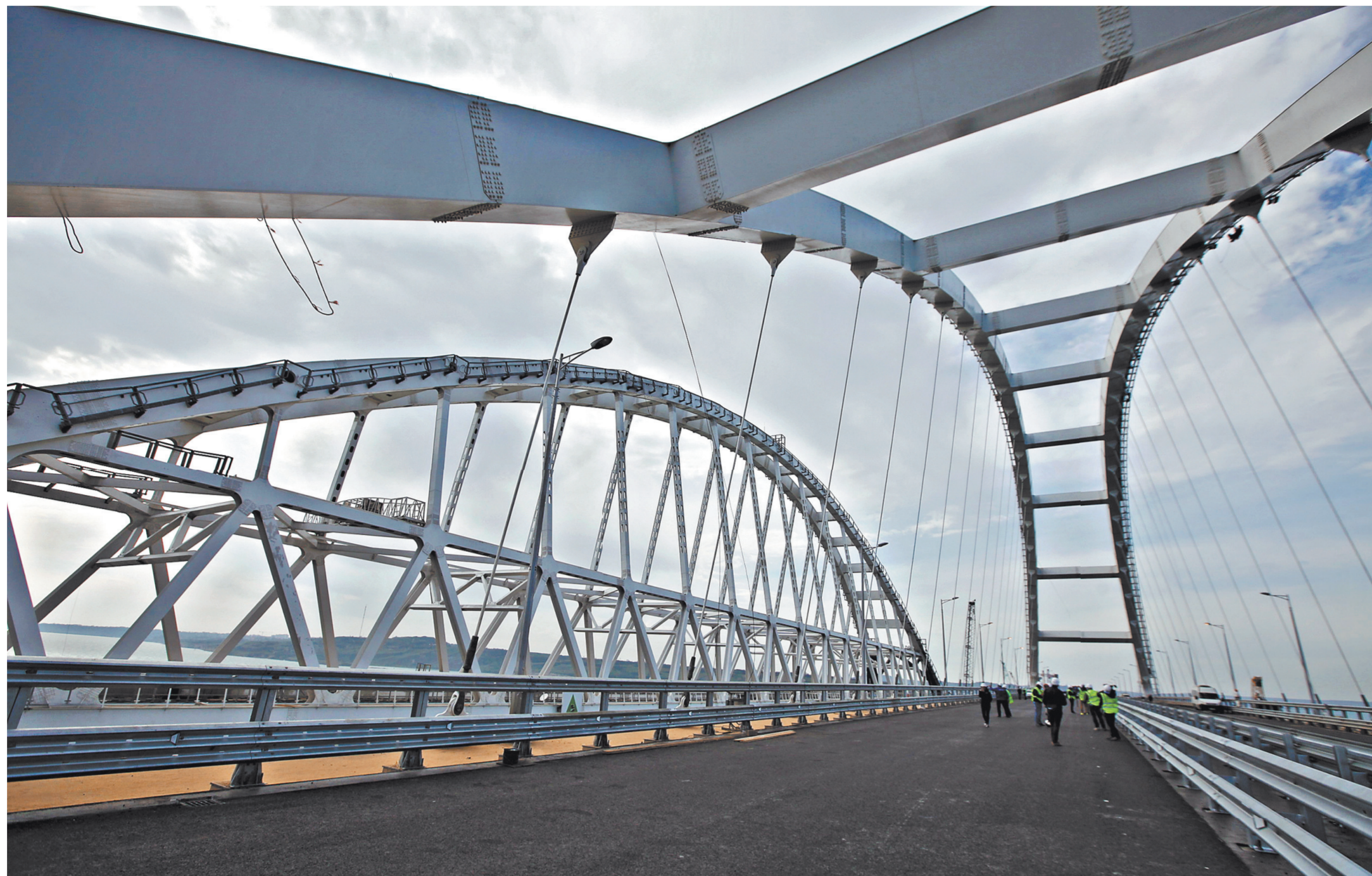
В центральном пролете моста заканчиваются работы по асфальтированию дорожного покрытия.

И началась Великая стройка. Я нарочно написал с большой буквы. Для России это был настоящий прорыв. Одна за другой иностранные фирмы и фирмочки из-за угрозы американских санкций отказывались принимать участие в проекте. А ведь забивать сваи под углом в илстый грунт, да еще связывать их потом со