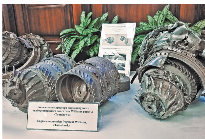
На улах и агрегатах сбитых ракет имеются отметки с серийными номерами, датами, названиями фирм-изготовителей и другие данные.

Часть ракет не достигла объектов поражения в Сирии, по всей видимости, из-за технических неполадок