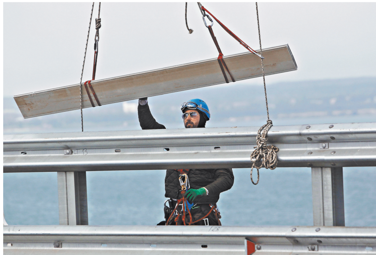
Последний штрих: промышленные альпинисты устанавливают панели ограждения.

сверхпрочным бетоном мы не умели... Теперь умеем. Научились. Жизнь заставила.