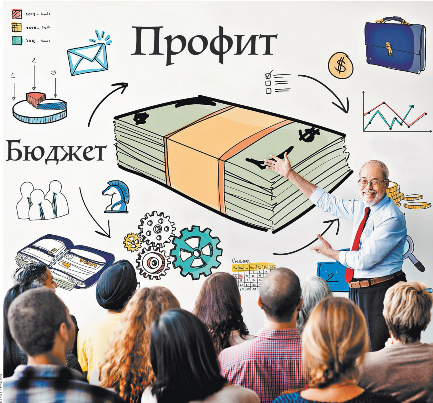
Сегодня высокий формальный образовательный потенциал населения слабо капитализируется.

Шохин: Ставка исключительно на симуляторы — чересчур односторонняя. Мировая практика показывает, что роль симуляторов в практикоориентированном образовании для разных квалификаций сильно различается. В СПО эффективна концепция дуального образования. Она способствует повышению качества подготовки и востребованности квалифицированных рабочих кадров в стране.