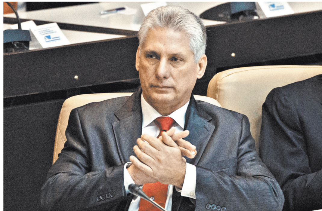
Мигеля Диаса-Канель Бермудеса на Кубе считают новатором, который идет в ногу со временем.

Несмотря на внешне кардинальные для острова изменения, Диас-Канель, избранный на пять лет, без всякого сомнения, продолжает революционный курс братьев Кастро. Рауль Кастро не ушел, а образно говоря, просто отодвинулся в тень, до 2021 года оставшись главой компартии Кубы. В своем первом выступлении в качестве главы Госсовета Кубы Диас-Канель пообещал «быть верным делу революции». «То, что мы можем ожидать от Мигеля Диаса-Канеля, — это непрерывность прежней политики и постепенная экономическая реформа, но не демократическая открытость или переход Кубы к более плюралистической политической системе», — полагает Диего Мойя-Окампо, старший аналитик IHS Markit. Диас-Канель имеет репутацию осторожного политика, который не склонен к резким шагам: одним из первых его решений было отложить реформу Совета министров до июля. Этот шаг явно свидетельствует о заинтересованности нового президента в кропотливых переговорах с так