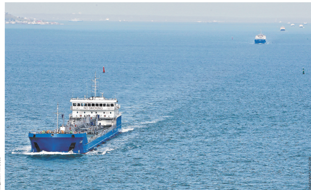
По главному фарватеру под мостом караваны судов следуют из Азовского моря в Черное.