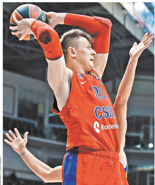
Баскетболисты «Химки» и ЦСКА сражались за победу до последних секунд матча.

Тем временем молодежная команда БК «Химки» в упорной борьбе обыграла «Локомотив-Кубань-2» в матче за третье место Единой молодежной Лиги ВТБ — 91:88 (22:31, 19:22, 33:22, 17:13). Стоит отметить, что по ходу встречи «молодежка» подмосковного клуба уступала 18 очков. Тем не менее «Химки-2» смогли преломить ход игры и добились красивой победы.