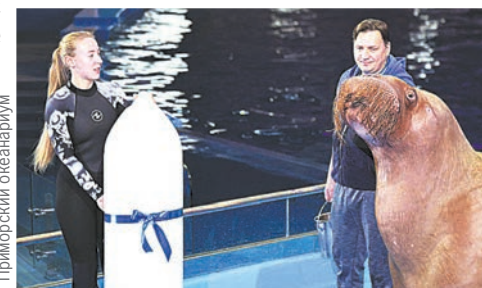
Подарок как раз по размеру млекопитающему, весящему почти тонну.

Но главное в работе тренеров - завоевать доверие животного, что достигается годами. Это возможно только при любви и внимании со стороны человека. А лакомства - хоть и обязательный, но вспомогательный элемент построения доверительных отношений.