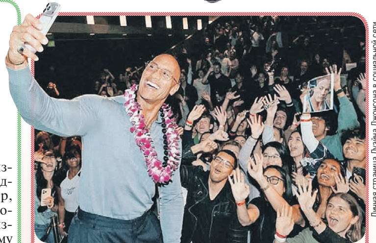
Личная страница Дуэйна Джонсона в социальной сети

«Железный человек», Шерлок Холмс и Люис Штраусс, похваливший нашего режиссера Юру Борисова на церемонии вручения «Оскар-2025», - это всем известный Роберт Дауни - младший. «Гений, миллиардер, плейбой, филантроп», как говорится. Его любят за харизму, ценят за очарование, ему поставили памятник в Италии. Поэтому огромное количество фанатов пишут Дауни-младшему не только в соцсетях, но и по старинке - на почту по адресу! Все, у кого нет такой возможности, стараются любым способом «достучаться» до звезды. Например, сильно постарались фанаты из Китая, куда Роберт в 2013 году приехал представлять третью часть «Железного человека» (часть сцен снимали в Пекине). Прямо на премьере артисту вручили открытку, которую подписали 5339 фанатов. Это и был рекорд Гиннеса. Автограф для поклонников - это норма, а вот роспись для звезды Голливуда - это крайне оригинально.