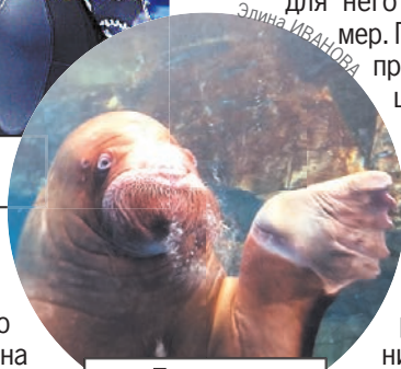
Главное в обращении с животными - любовь и внимание.

Поздравить моржа приплыли его друзья и «коллеги» - белуха Мий, северный морской котик Марио, дельфины Вася и Эм. Вместе с именинником они кружились в танце, обменивались поздравительными жестами и дружескими «поцелуями». Дельфины даже исполнили для него вокальный номер. Правда, делиться праздничными угощениями Миша ни с кем не стал.