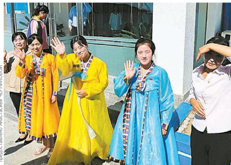
Русских радушно приветствовали буквально на каждом шагу.

Выйти в сеть, чтобы общаться через онлайн-переводчик, не получилось. У одного из пассажиров нашелся лишь сувенирный русско-корейский разговорник. В нем среди фраз