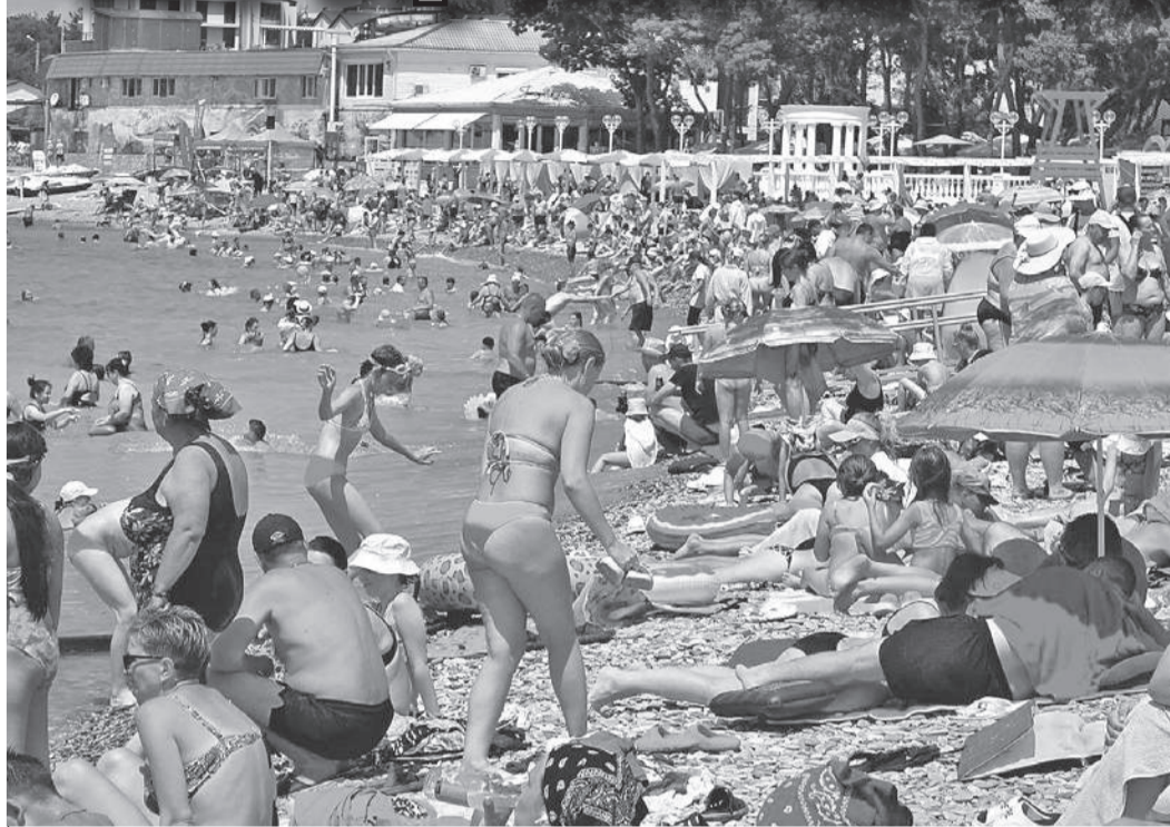
В Геленджике открылись 74 пляжа - чем дальше от центра, тем места на них станет больше.

С самолетами на курорт сейчас такая же проблема, как и с поездами к Черному морю, - мест практически не остается. На конец лета свободных билетов остались единицы. Да и цены на них кусаются - в начале августа полет из Москвы в Геленджик обойдется в 48 тысяч рублей. Но уже с 15-го числа дешевле - около 18 тысяч. Это связано в том числе и с тем, что к этому времени на курорт будет больше рейсов. А вот с 1 сентября можно найти место и за 16 тысяч.