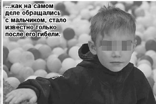
...как на самом деле обращались с мальчиком, стало известно только после его гибели.

Олег ГАЛИМОВ, Виктория ЖУРАВЛЕВА («КП» - Екатеринбург)