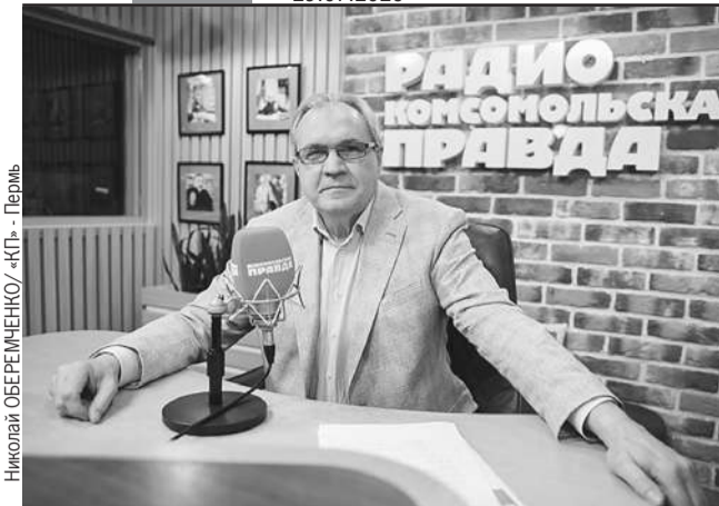
Николай ОБЕРЕМЕНКО/«КП» - Пермь