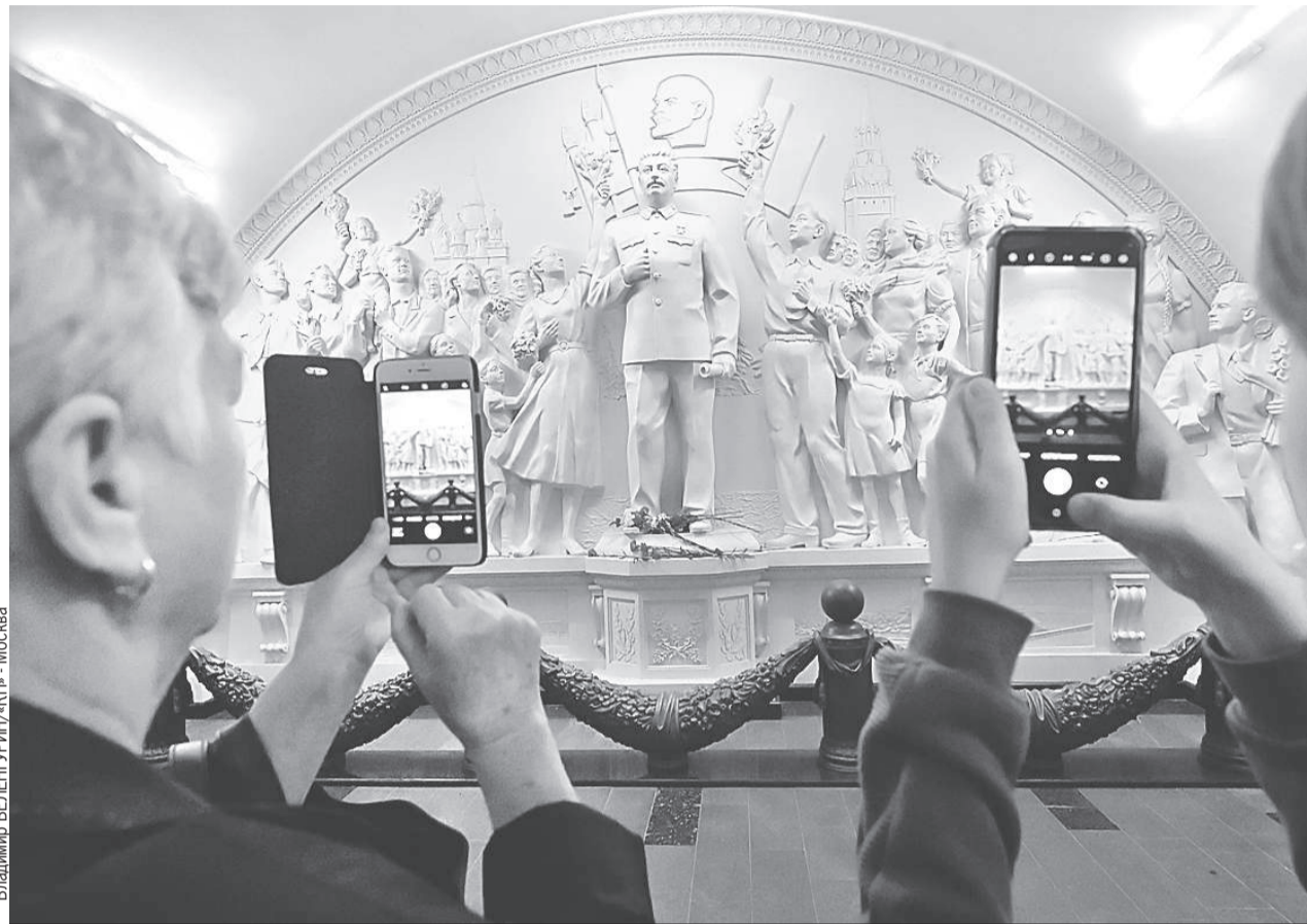
Возвращение барельефа Сталина в метро Москвы наделало много шума. А ведь это лишь дань истории к 90-летию подземки. Кто-то кладет к ногам вождя цветы, кто-то делает селфи, но большинство проходят мимо. Вернули - и ладно.

- Спецслужбы действуют по закону об оперативно-разыскной деятельности. Чтобы начать за нами следить, нужно решение суда или в крайнем случае прокуратуры. Тай-