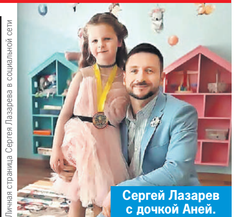
Личная страница Сергея Лазарева в социальной сети