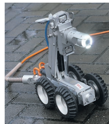
Без этого помощника не обойтись при обследовании труб.

гиональный уровень и определен подведомственным предприятием министерства строительства и ЖКХ Калининградской области. Предприятие обслуживает 2 363,5 км сетей водоснабжения и 1 401,7 км сетей водоотведения по области. На предприятии трудятся более 2,5 тысячи человек; за последние 4 года созданы более 900 новых рабочих мест.