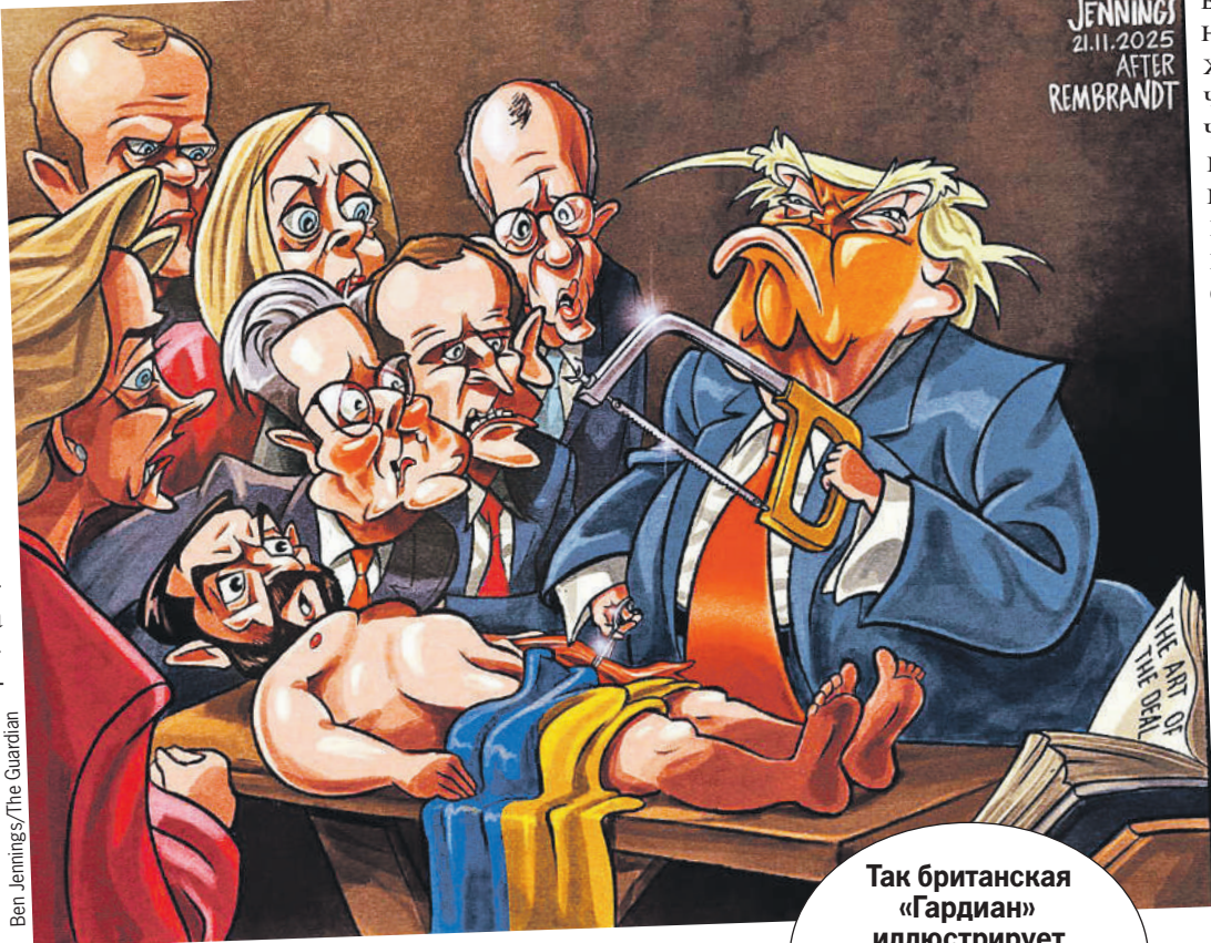
Ben Jennings/The Guardian

Есть другая сторона. Ситуация в Евросоюзе сложная, и непонятно, куда она дальше пойдет. Европейская модель давно шла в направлении тупика - настолько изменились все международные обстоятельства. Все, что было их преимуществами, ста-