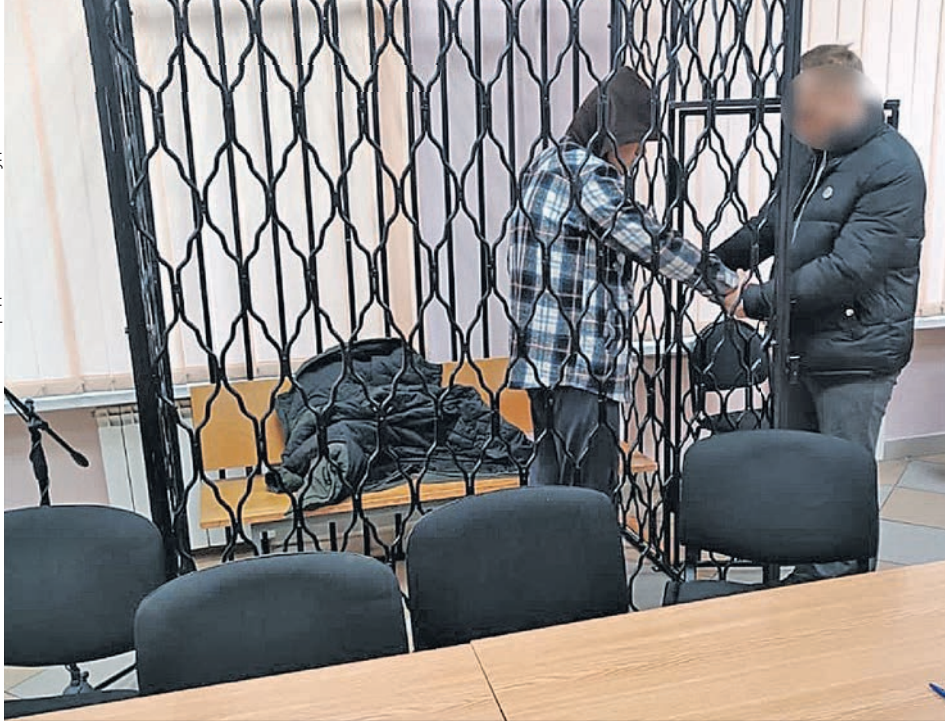
Подростка-подозреваемого отправили в СИЗО.