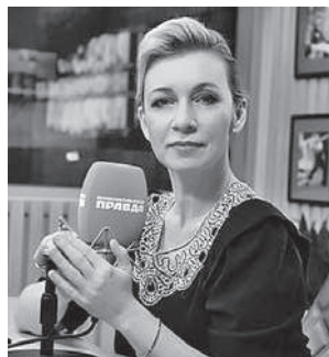
Официальный представитель МИД России Мария ЗАХАРОВА.

деньги шли на счета, аффилированные с ними же... Конгломерат казнокрадства, взяточничества, коррупции. Все это приобрело на Украине просто невиданные масштабы, стало настоящей какой-то международной мафиозной структурой. Гнойник кровавый по отмыванию средств. Не только по воровству, а просто глобальному изъятию миллионов, а на самом деле миллиардов».