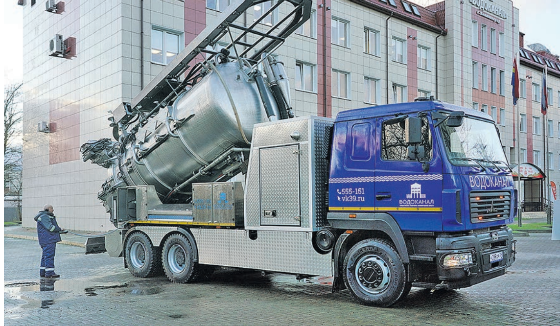
Каналопромывочная машина будет очищать коллекторы большого диаметра и ликвидировать засоры.

За 2025 год предприятие заменило более десяти километров водопроводных сетей и