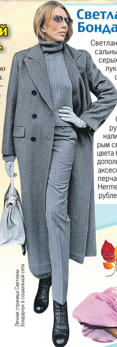
Личная страница Светланы Бондарчук в социальной сети