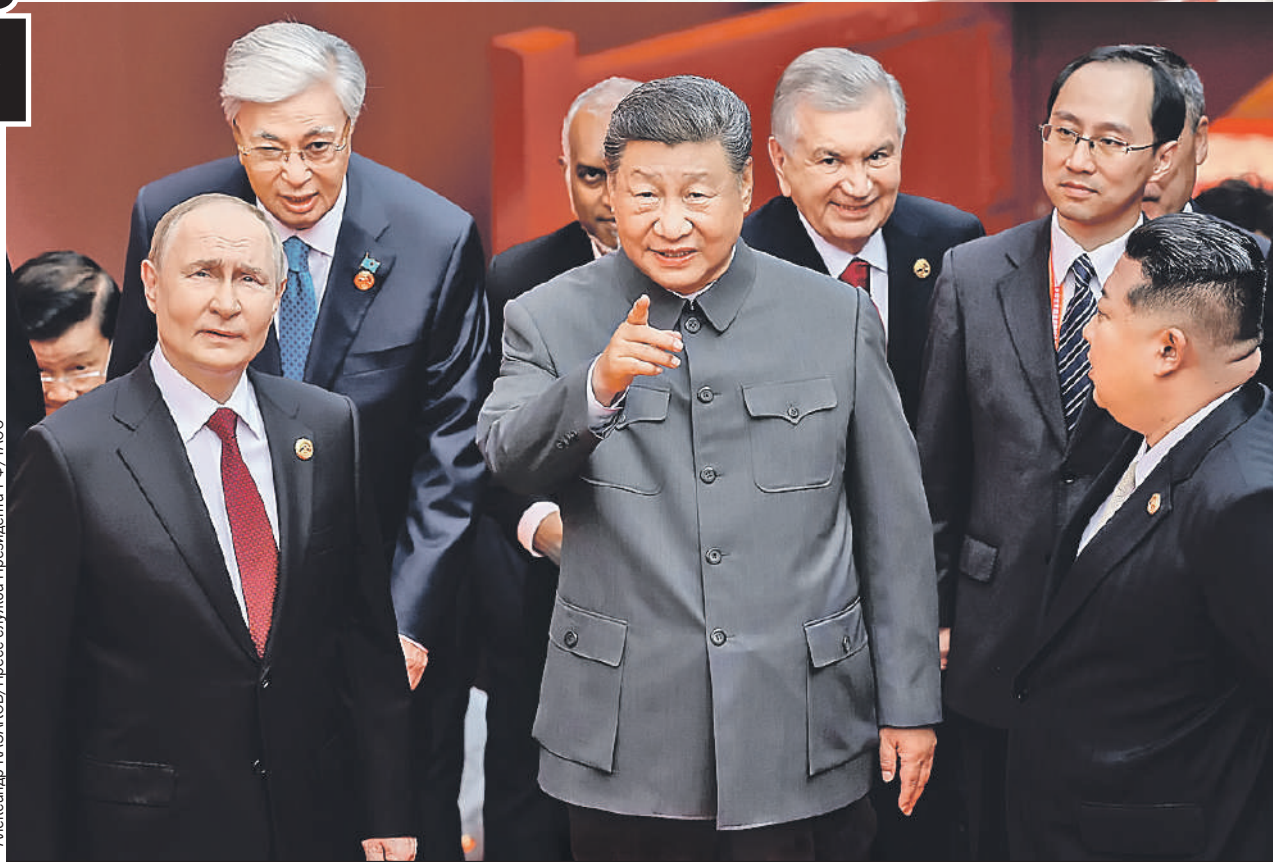
Владимир Путин, председатель КНР Си Цзиньпин и лидер КНДР Ким Чен Ын (слева направо) подтвердили свое стремление к миру во всем мире на военном параде по случаю 80-й годовщины Победы китайского народа в войне с Японией.

- Я думаю, что окопной войны у нас с Европой не будет. Какие сценарии обсуждаются? (Они, к сожалению, не исключены.) Балтийское море, какие-то страны, может быть, даже самовольно решили показать, что они о-го-го, и перехватили какое-нибудь наше судно, еще чего-то. Я уж не говорю про некоторых отморожков, которые говорят про торговую блокаду Калининграда. Это, если кто-то решит, это то, что называется в практике casus belli (формальный повод для объявления войны. - Ред.). Здесь, думаю, Россия вообще не будет уже стесняться и будет просто военным путем напрямую отвечать.